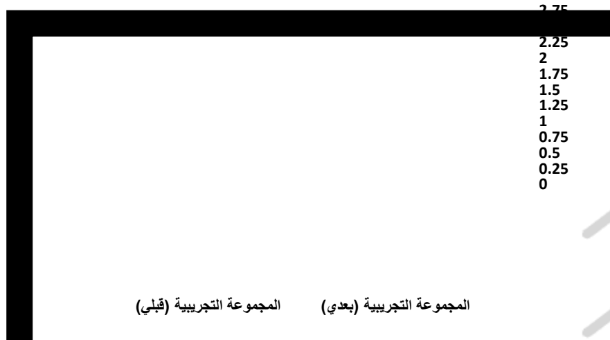
شكل (4): متوسطات درجات أطفال المجموعة التجريبية في التطبيقين القبلي والبعدي لاختبار المفاهيم الدينية المصور

ويوضح الشكل التالي متوسطات درجات أطفال المجموعة التجريبية في التطبيقين القبلي والبعدي لاختبار المفاهيم الدينية المصور: