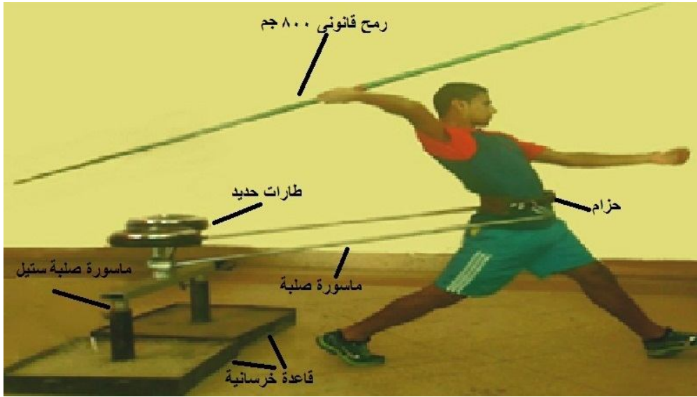
شكل (٢) الأداء الفني على جهاز الحوض المثبت في مسابقة رمي الرمح