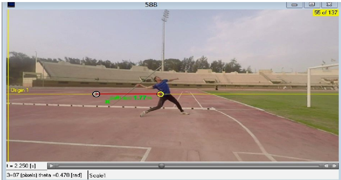
شكل (٣) مسار التسارع في مسابقة رمي الرمح لأحد متسابقى المجموعة التجريبية