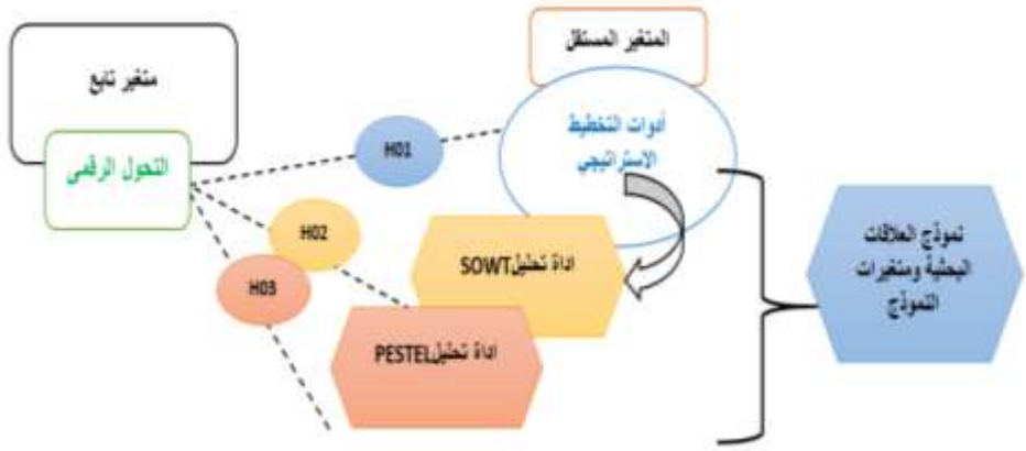
شكل (1) نموذج العلاقات البحثية