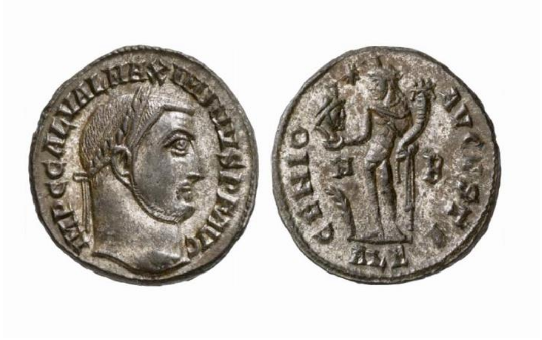
الشكل رقم (٣) ٣٣ عمله رومانية عصر الإمبراطور هادريان