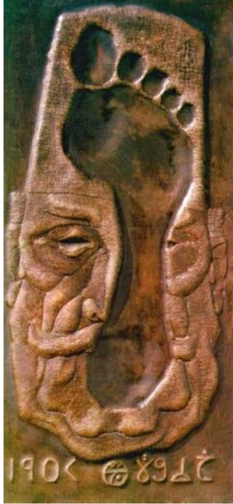
الشكل رقم (٥) جمال السجيني ٣٥ السلطة